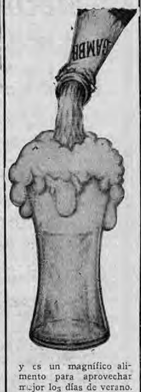
Y es un magnífico alimento para aprovechar mejor los días de verano.