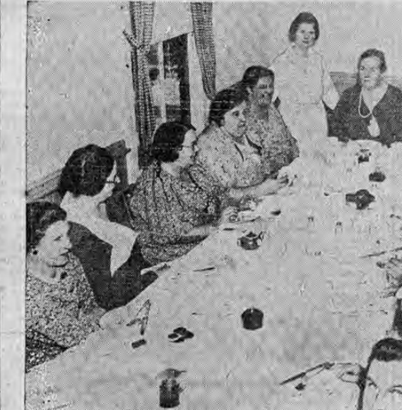
Los miembros del Jurado tomando el desayuno en un hotel de Flemington.