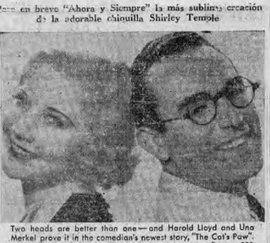
Two heads are better than one— and Harold Lloyd and Una Merkel prove it in the comedian's newest story, "The Co's Paw".

En breve "Ahora y Siempre" la más sublime creación de la adorable chiquilla Shirley Temple