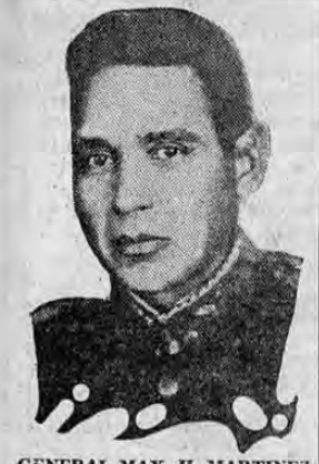
GENERAL MAX H. MARTINEZ

San Salvador, 15. El general Maximiliano Hernández Martínez ha sido reelecto presidente de la república, habiendo recibido 328.422 votos en las elecciones que terminaron hoy.