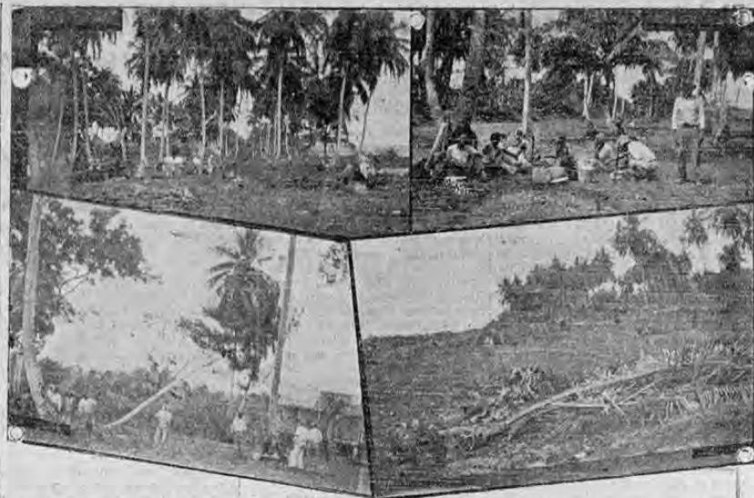
La foto muestra diversos aspectos de los trabajos que se están ejecutando para acondicionar el aeropuerto de Limón. — Parte superior, izquierda: vista de los árboles de coco que serán cortados; derecha, grupo de detenidos de agencia que trabajan en el campo, durante el rancho. — Parte inferior, izquierda: un árbol de coco cayendo; derecha, vista parcial del campo libre ya de yerba y árboles de coco.

En el Registro Cívico intensifican las labores en el empeño de su director de purificar los registros electorales para tenerlos en perfectas condiciones para fin de año, y, a ese efecto llevávanse a cabo multitud de informaciones con buenos resultados, descubriéndose en varios casos inscripciones de un mismo ciudadano en varias localidades, lo que viene por el desdoblamiento de las gentes en el declarar sus cambios de residencia.